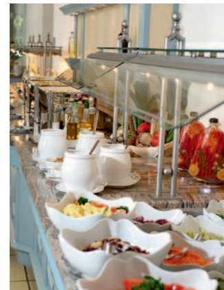
Stilvoll: das Buffet