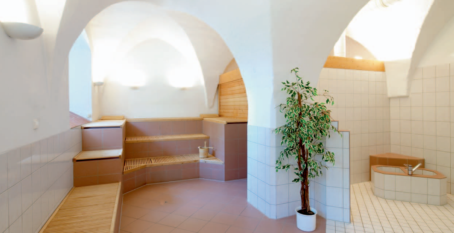
Erholsam: Saunabereich im Gewölbekeller