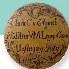
Bodeneinsatz des Eugeniuskelchs. Die Inschrift ergibt als Chronogramm die Jahreszahl 1768

Erst mit dem Schwäbischen Tagungs- und Bildungszentrum ist der Geist schöpferischer Konzentration nach Kloster Irsee zurückgekehrt – gepaart mit zwangloser Heiterkeit und toleranter Gemeinschaft: Wo im 18. Jahrhundert nur etwa zwei Dutzend Mönche im benediktinischen Geist zusammenlebten, beherbergt das Schwäbische Bildungszentrum heute annähernd 20000 Tagungsgäste jährlich.