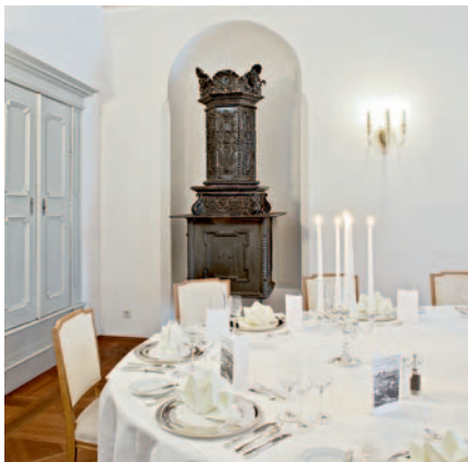
Familiär: das Empfangszimmer