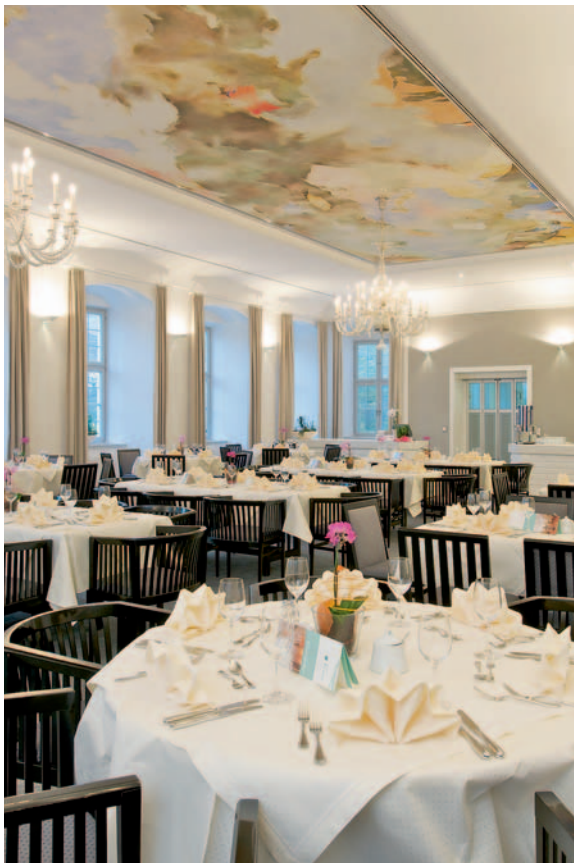
Einst Refektorium – heute Restaurant

Klösterliche Lebensfreude findet ihren Ausdruck auch in kulinarischen Genüssen – damals wie heute. Im ehemaligen Refektorium der Mönche, dem heutigen Restaurant, werden unter dem subtilen Farbenspiel eines modernen Deckengemäldes ausgesuchte regionale und internationale Köstlichkeiten serviert. Größten Wert legen Küchenchef und Restaurantleitung auf frisch zubereitete, leicht bekömmliche Speisen, die auf die Tagungsbedürfnisse der Gäste abgestimmt sind.