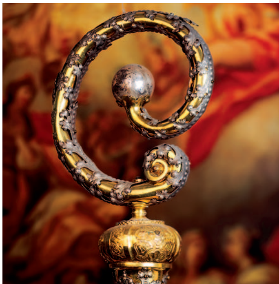
Stab des Honorius Griening, letzter Abt von Irsee (1784–1802)