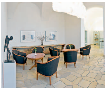
Ein gemütliches Refugium: das „Café Kunstsommer“