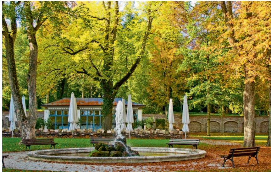
Stimmungsvoll: Orangerie im Klostersgarten