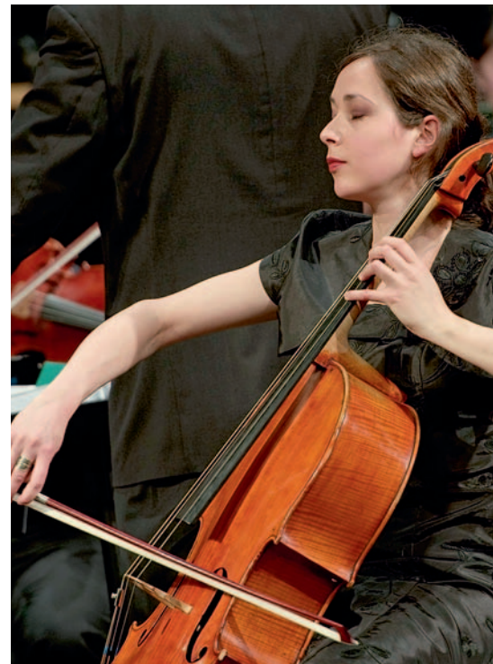
Musik in Kloster Irsee – in der Vielfalt ihrer Ausdrucksformen