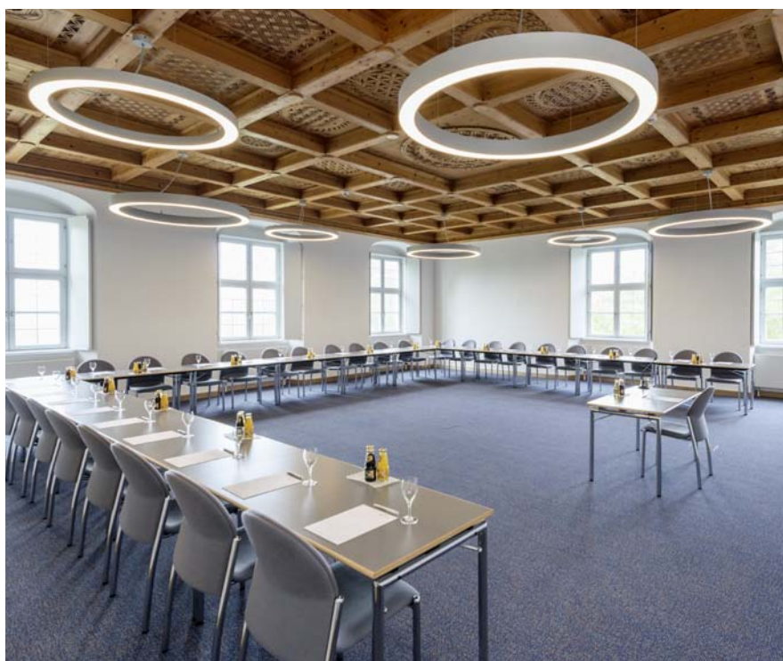
Multifunktional: großzügiger Konferenz- raum mit Kassettendecke