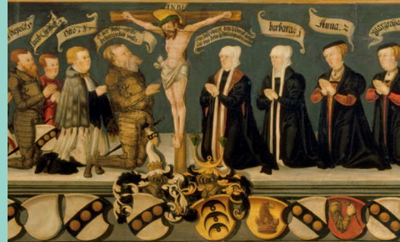
Gedenktafel des Simprecht von Benze- nau, der 1551 seine Rechte über Kloster Irsee verkaufte