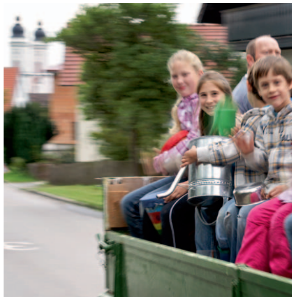
Seit vielen Jahren einzigartig: der Irseer Kunstsommer