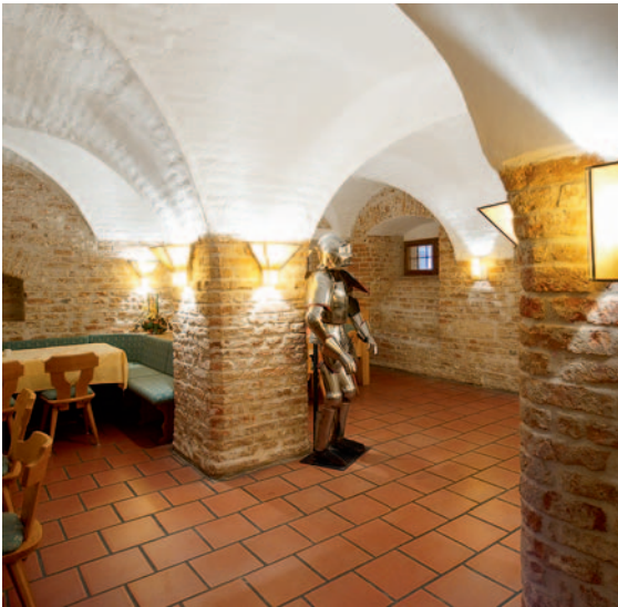
Gemütlich: Stiftskeller mit Ritterstübchen