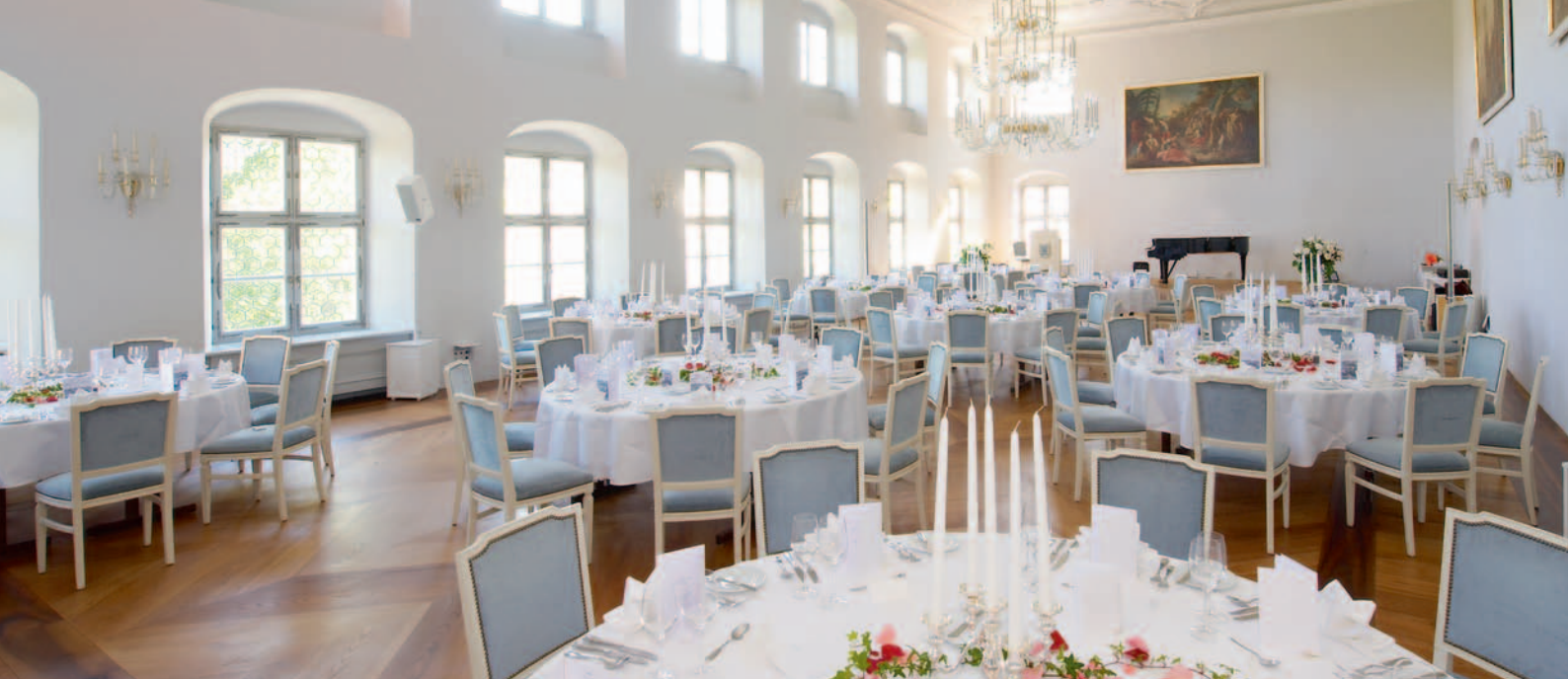
Großzügig: der Festsaal