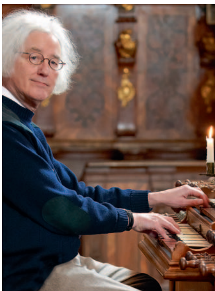
Die barocke Balthasar-Freiwilb-Orgel von 1754 versammelt arrivierte Meister und junge Stimmen

Darüber hinaus finden zweimal im Jahr erlesene Musik und exquisite Kulinarik zueinander: Im Rahmen der „Irseer Diner-Konzerte“ erschaffen internationale Musiker und die erfahrene Küchenmannschaft von Kloster Irsee einzigartige Kompositionen der genussvollen Art.