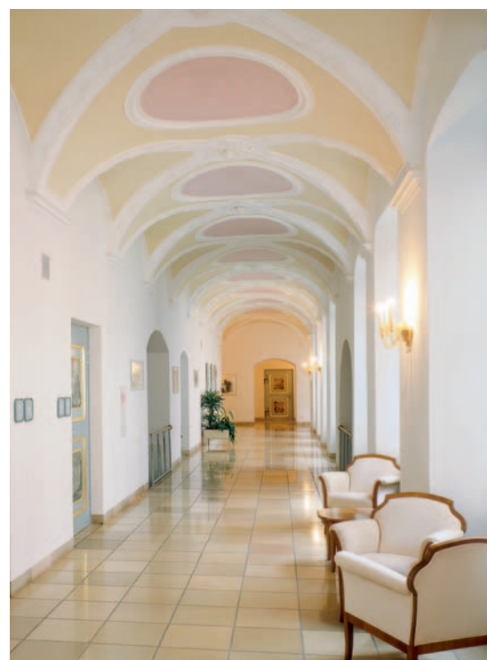
Die weiten Kreuzgangflure werden gerne für Ausstellungen und Präsentationen genutzt